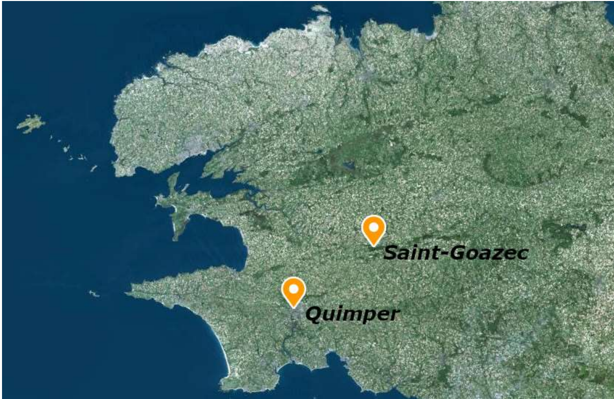
Figure 1 : Carte du Finistère, localisant Quimper et Saint-Goazec. Echelle 1 : 1 091 521