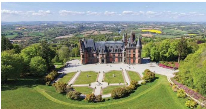
Figure 2 : Vue aérienne du Domaine de Trévarez