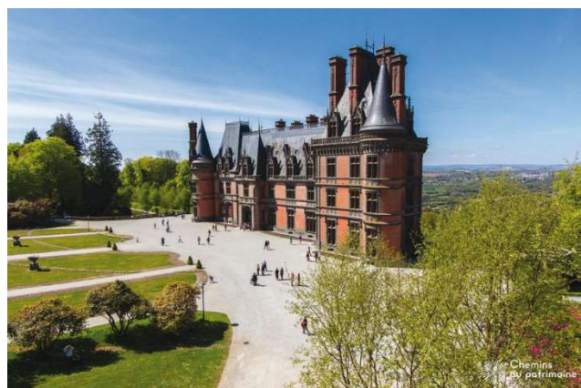
Figure 3 : Vue du château de Trévarez