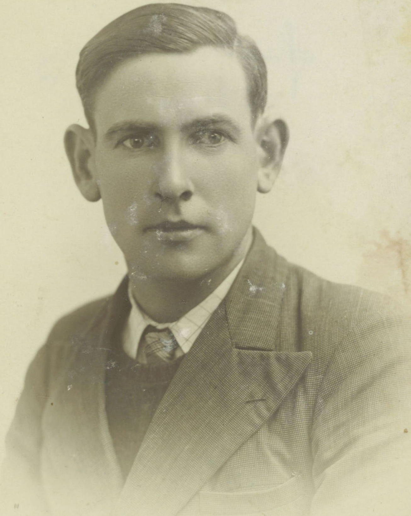
LE MERDY CONCERNES